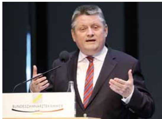
Hermann Gröhe, Bundesgesundheitsminister