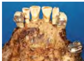
Oberkiefer ohne Modellgussanteil von palatinal Rillen-Schulter-Frässungen bei 13 und 23; Vollgusskrone 27