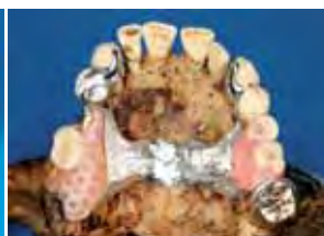
eingegliedert kombinierter feststehend und herausnehmbarer Zahnersatz im Oberkiefer