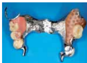
Modellgussprothese von oral