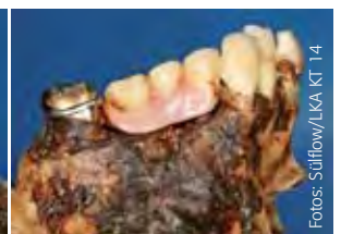
Detailansicht Klammer 27