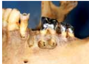
Zustand nach WSR bei 34,35,36 mit retrograden Wurzelfüllungen (35 mit NEM-Krone entnommen) NEM-Kronen 36,37

Der Polizeipräsident in Berlin Landeskriminalamt – LKA114 4. Mordkommission Keithstraße 30, 10787 Berlin Telefon 030 - 4664 911 400 oder jede andere Polizeidienststelle