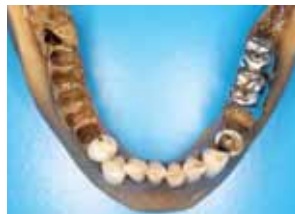
Unterkiefer-Übersicht (35, 45-48 für DNA-Untersuchung entnommen)