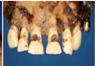
Oberkiefer-Front mit multipler Karies und vestibulär verblendeten Kronen 13 und 23 27 Vollgusskrone goldhaltig