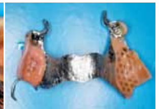
Modellgussprothese mit Duolock®-Geschiebe von palatinal