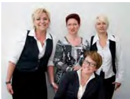
Mitarbeiterinnen der Berliner Zahnärztlichen Patientenberatung