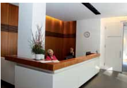
Willkommen in der KZV Berlin – Empfang

I m ARD-Jahresrückblick nachgesehen, waren einige der Schlagzeilen des Jahres 1954: Deutschland ist Fußball-Weltmeister! Oder: Spannend verlaufen die Wettkämpfe im Skispringen; im norwegischen Oslo startet die bundesdeutsche Gundi Busch und erringt im Alter von 18 Jahren den Weltmeistertitel im Eiskunstlauf der Damen. Auch der Bundeskanzler begibt sich auf Reisen. In Griechenland besucht Adenauer alte Kulturstätten, in der Türkei frischt er die alte deutsch-türkische Freundschaft auf. Und im Weißen Haus in Washington besucht Bundeskanzler Adenauer den amerikanischen Außenminister Dulles, mit dem er den deutsch-amerikanischen Freundschaftsvertrag unterzeichnete.