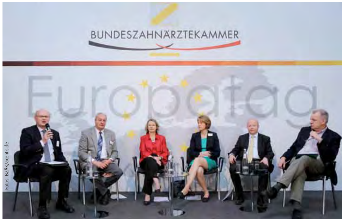
Für die Zahnärzteschaft relevante Fragen erörterten Gesundheitspolitiker des Europaparlaments und des Deutschen Bundestages.

Ein deutliches Pro-Europa-Statement gab die Staatssekretärin Widmann-Mauz in ihrem Impulsvortrag. Sie erinnerte daran, dass es fast ein politisches Wunder sei, dass heute in Europa viele Länder mit unterschiedlicher Historie und Situation „alle friedlich an einem Tisch