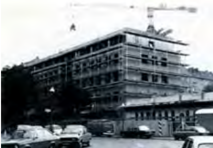
Richtfest im Sommer 1981