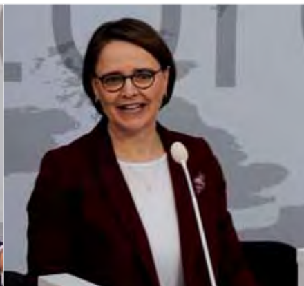
Annette Widmann-Mauz, Parlamentarische Staats- sekretärin im Bundesgesundheitsministerium