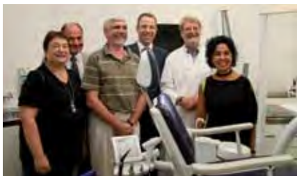
Eröffnung des Zentrums für die zahnärztliche Behandlung von Menschen mit Behinderungen am Vivantes Klinikum Neukölln