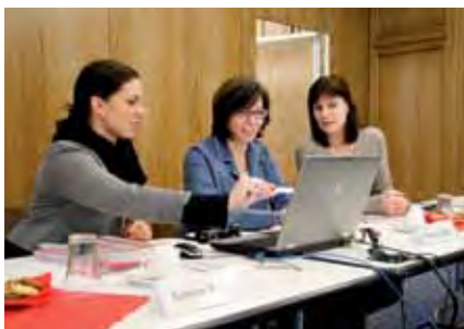
KZV-Fortbildungsveranstaltung für Mitarbeiter der Abrechnung