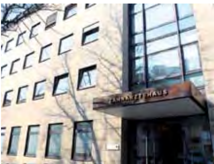
Ihre KZV Berlin in der Georg-Wilhelm-Straße