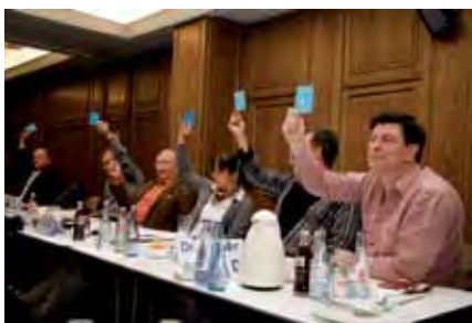
Vertreterversammlung der KZV Berlin