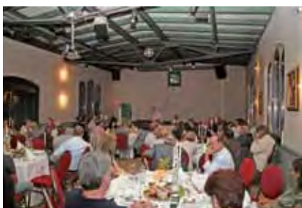
Der KZV-Vorstand in Ihrem Bezirk

1995 | Mit drei Jahren Verspätung geht die Krankenversichertenkarte an den Start und ersetzt ab sofort den Krankenschein.