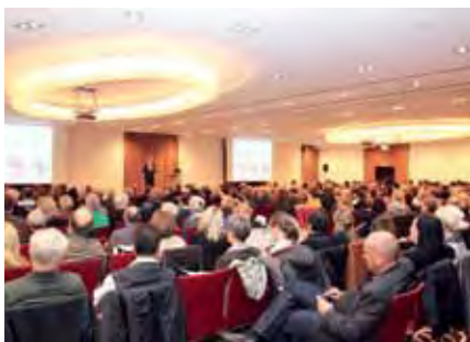
Beliebte Veranstaltung – Herbstsymposium