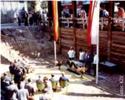
Grundsteinlegung für das Zahnärztheaus am 27. August 1980