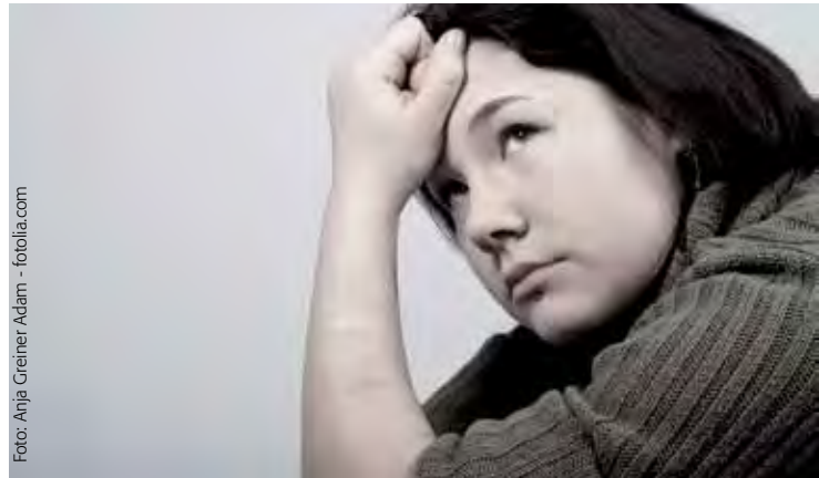
Zahnmedizinische Probleme stehen oft in Zusammenhang mit psychischen Belastungen.

Im vertrauensvollen Gespräch mit dem Patienten kommen fast immer auch die persönliche Lebenssituation und Schwierigkeiten zur Sprache. Mit viel Einfühlungsvermögen lassen sich dann häufig eine Verbindung zu körperlichen Beschwerden herstellen und ganz individuelle Lösungen besprechen.