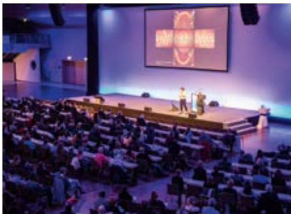
ZÄK Berlin | axentis.de