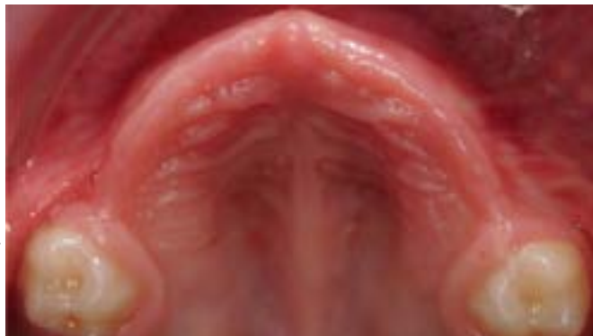
Abb. 1: Okklusale Ansicht des Oberkiefers. Wegen akuter Zahnschmerzen und mangelnder Kooperation diverse tief kariös zerstörte Milchzähne in Intubationsnarkose entfernt.

Eine intraorale Untersuchung bei Erstvorstellung ergab, dass im Oberkiefer alle Zähne bis auf die Milch-5er entfernt wurden (Abb. 1), im Unterkiefer wurden hingegen nur 74 und 84 extrahiert. Zur Abschätzung der Kooperation und Desensibilisierung für eine potenzielle Behandlung wurden die Zähne des Kleinkindes mit einer Plaque-Anfärbelösung bemalt und mit einem rotierenden Bürstchen geputzt. Dazu wurden verschiedene Techniken der Verhaltensformung (u. a. Tell-Show-Do und Pausen-Hand) [AAPD 2005a] und hypnotischen Kommunikation genutzt. Außerdem wurden die Eltern zu Mundhygiene- und Ernährungsgewohnheiten