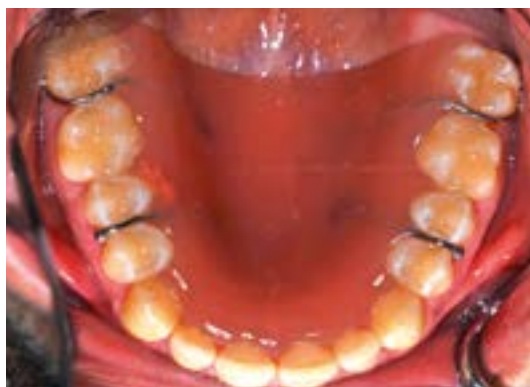
Einprobe der Gaumenplatte am Kommilitonen