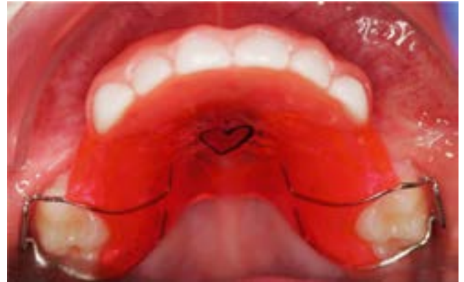
Abb. 2: Okklusale Ansicht des Oberkiefers mit der Kinderprothese