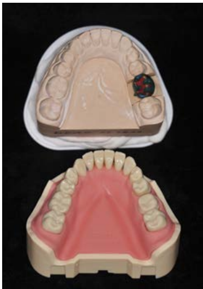
Mit der Anfertigung einer Vollgusskrone werden von der Provisoriumschiene über die Gesichtsbogenübertragung bis zur fertigen Krone alle zahntechnischen und klinischen Arbeitsabläufe eingeübt.

Abteilung für Zahnärztliche Prothetik, Alterszahnmedizin und Funktionslehre