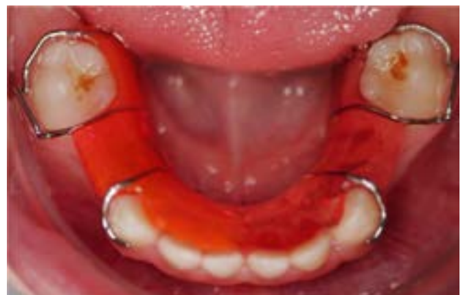
Abb. 3: Okklusale Ansicht des Unterkiefers mit herausnehmbarem Lückenhalter

befragt, beraten (u. a. motivierende Gesprächsführung) und instruiert. Nach der Untersuchung erfolgte eine Beratung zu den Therapiezielen: Lebensqualität durch langfristig gesunde Zähne und ein vertrauensvolles Verhältnis zum Zahnarzt.