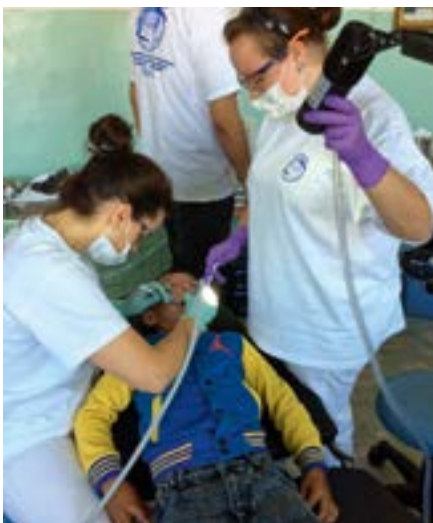
An 14 verschiedenen Einsatzorten werden in mobilen Zahnkliniken vor allem Kinder zahnmedizinisch versorgt.

Weitere Informationen zur Arbeit der DWLF-Stiftung und zu Spendenmöglichkeiten finden Sie unter: www.dwlf.org