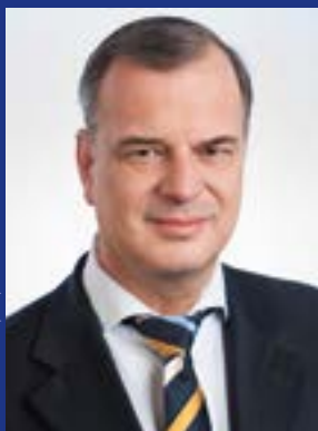
ZAK Berlin