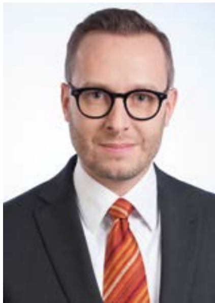
ZAK Berlin | Capital Headshots Berlin

Seit den letzten Jahren erleben wir den Wandel von einer überwiegend selbstständig tätigen Zahnärzteschaft hin zu einer wachsenden Anzahl von angestellten Zahnmedizinern. Dies hat den Vorstand veranlasst, auch die Beratungsangebote für nicht selbstständige Kammermitglieder auszubauen. Alle Fragen zur Vereinbarkeit von Familie und Beruf und die Möglichkeiten der fachlichen Weiterbildung werden auch durch die Zahnärztekammer Berlin kompetent beantwortet. Hier ändern sich