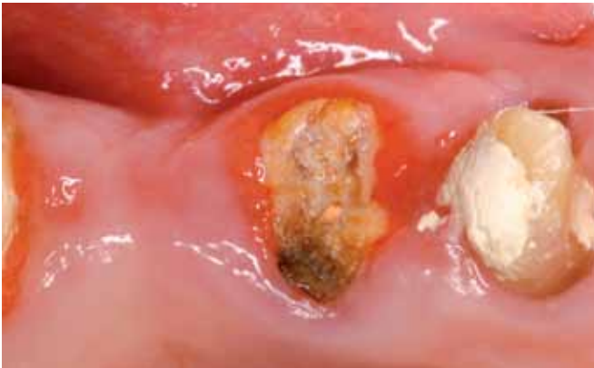
Alveolarkamm vor und nach der Socketpreservation

Für die Berechnung der beschriebenen Leistung soll – laut Begründung des Verordnungsgebers zur neuen GOZ auch bei