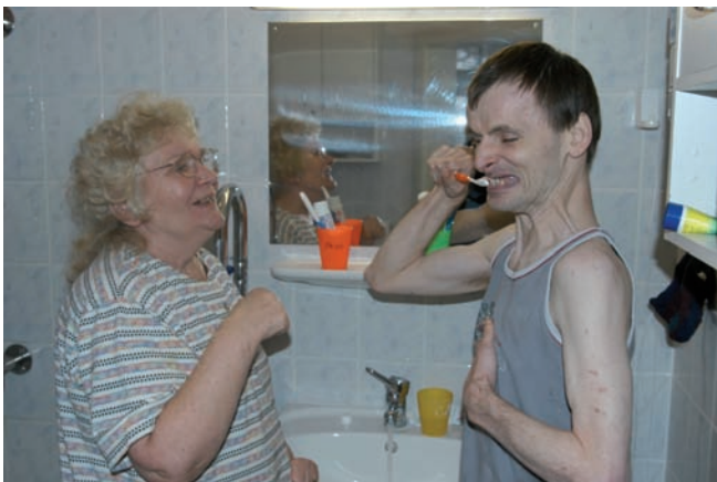
Abb.: Bewohner während der angeleiteten Zahnpflege

Langfristige Etablierung dieses Projektes und Sicherstellung der Finanzierung als gesamtgesellschaftliche Aufgabe im Sinne der Daseinsfürsorge für Mitmenschen mit Behinderungen.