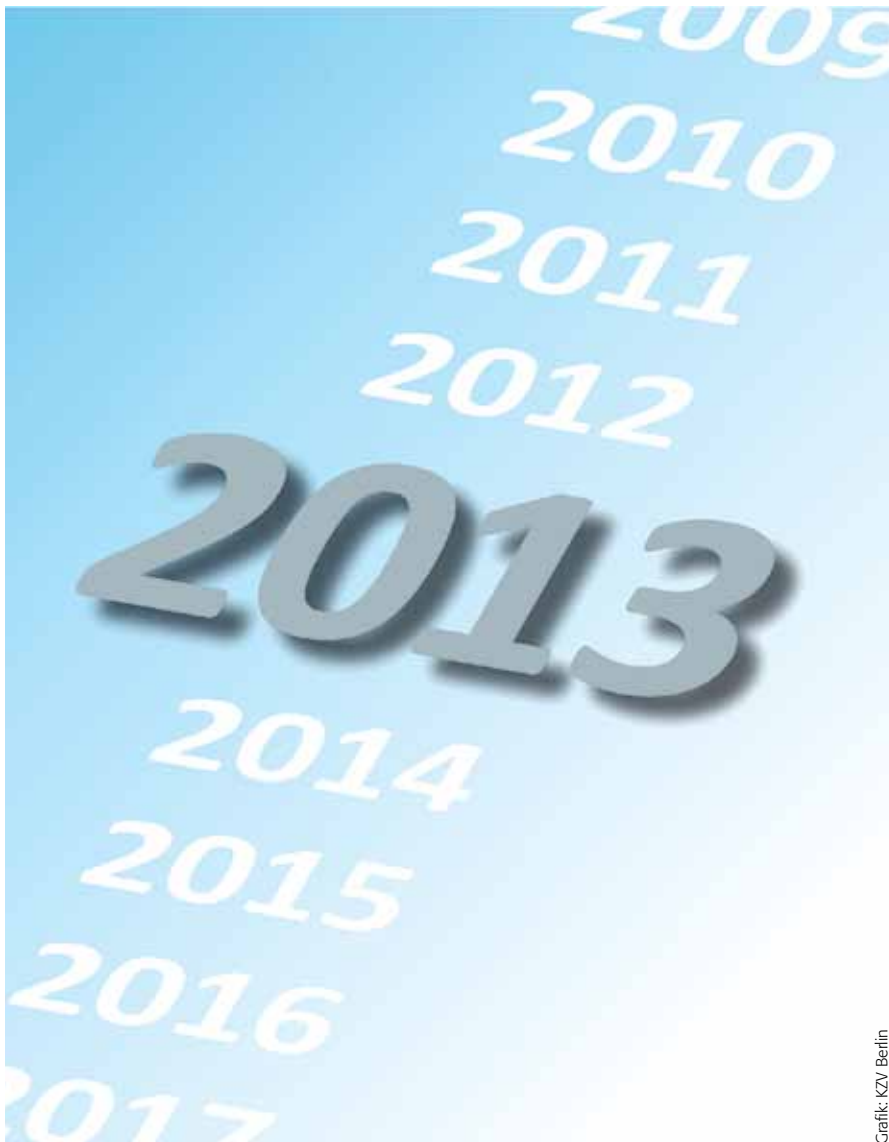
Grafik: KZV Berlin

das Rentenversicherungsniveau sowie die Verbeitragung aller Einkommensarten. Unterschiede bestehen ebenso im Finanzierungsprinzip sowie in der Ausgestaltung der Familienversicherung.