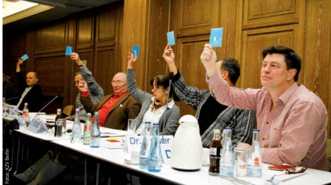
Die Vertreterversammlung stimmt ab

Dennoch kritisierten einige Mitglieder die in ihren Augen noch vorhandenen unklaren Formulierungen. Es wurde betont, konstruktive Änderungsvorschläge in die Formulierungen einfließen zu lassen. Derartige Vorschläge blieben jedoch letztlich aus. Für den Vorstand ist die hier beschriebene Regelung eindeutig formuliert und gängige Praxis; er betonte nochmals, dass