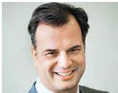
Dr. Michael Dreyer

Kein neues Thema; schon im alten China wurden Ärzte dafür bezahlt, ihre Patienten gesund zu erhalten. Bereits die chinesischen Heiler rieten zu gesundheitsförderlichen Verhaltensweisen, um damit gesundheitliche Risiken zu reduzieren, wie es im aktuellen Gesetzentwurf formuliert ist. Wie weit die alten Chinesen damals auch an die Verbesserung der Rahmenbedingungen für die betriebliche Gesundheitsförderung sowie die Förderung des Wettbewerbes der Krankenkassen gedacht haben, ist nicht überliefert. Die Einrichtung einer Ständigen Präventionskonferenz beim Bundesgesundheitsministerium wird sicherlich nicht ihr Ziel gewesen sein, im Zweifelsfalle aus Kostengründen.